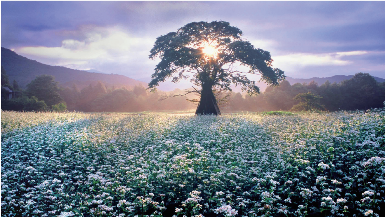
裏磐梯蕎麦畑

編集・発行／太田熱海病院サービス向上委員会 発行日／令和6年8月30日 住 所／〒963-1383 郡山市熱海町熱海5丁目240番地 TEL (024) 984-0088 ホームページ：http://www.ohta-hp.or.jp/