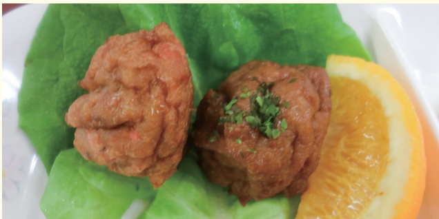
(写真は一人分です)

郡山市は「鯉」の生産量が全国第1位であることを知っていますか？鯉は、たんぱく質やビタミン類を豊富に含んでおり、古くから「病気予防・体力回復の薬食」として食されてきました。郡山市で育つ「鯉」はミネラルを豊富に含んだ良質な水で育てられているため、泥臭くなく、身がみずみずしくなっています。今回は、地産地消をテーマにしたレシピをご紹介します。昔懐かしい旨煮風と現代風にアレンジした紅生姜風味の2種類の味が楽しめるレシピです。是非、お試しください。