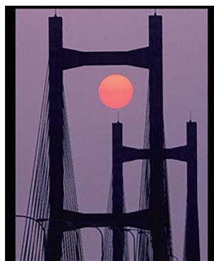
写真題名「ベイブリッジ昇陽」