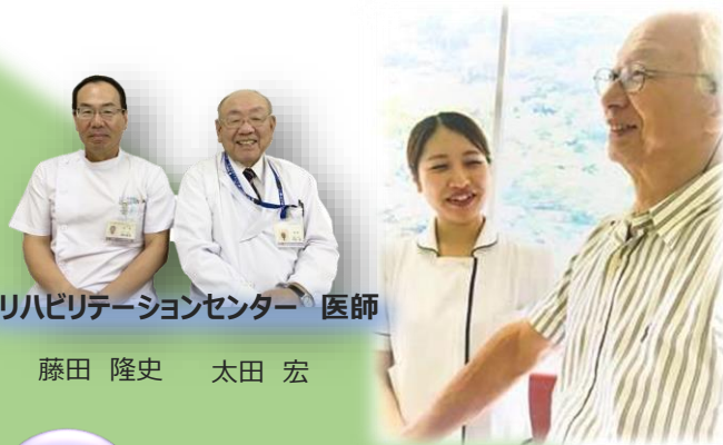
リハビリテーションセンター 医師

高齢になっても、体に障害があっても、ご自分の身体機能や能力を最大限に生かして生き生きと暮らしていけるようにサポートしています。