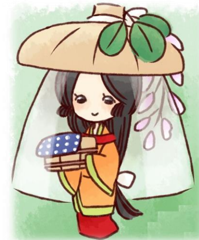
萩姫イメージキャラクター 磐梯熱海温泉協同組合