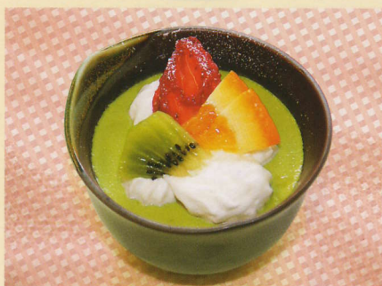
1人分 エネルギー 254kcal